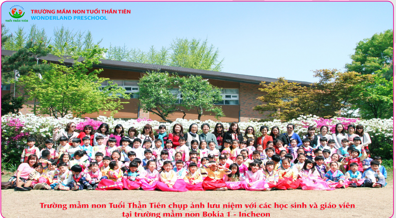
Trường mầm non Tuổi Thần Tiên chụp ảnh lưu niệm với các học sinh và giáo viên tại trường mầm non Bokja 1 - Incheon

Tại Việt Nam, Hệ thống Tuổi Thần Tiên là trường mầm non duy nhất trực thuộc Viện Bokja - Viện nghiên cứu Phương pháp Montessori lớn nhất Hàn Quốc và có trụ sở tại nhiều nước trên thế giới. Với sự hợp tác Việt - Hàn, Nhà trường được viện Bokja tài trợ về các công tác thiết kế hệ thống phòng học, đào tạo đội ngũ giáo viên và chuyển giao chương trình giảng dạy. Hàng năm, đội ngũ giáo viên của Nhà trường đều được đào tạo, tập huấn, nâng cao trình độ về phương pháp Montessori bởi các chuyên gia đến từ Viện Bokja - Hàn Quốc.