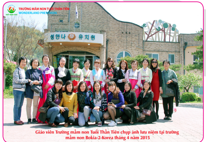
Giáo viên Trường mầm non Tuổi Thần Tiên chụp ảnh lưu niệm tại trường mầm non Bokja-2-Korea tháng 4 năm 2015