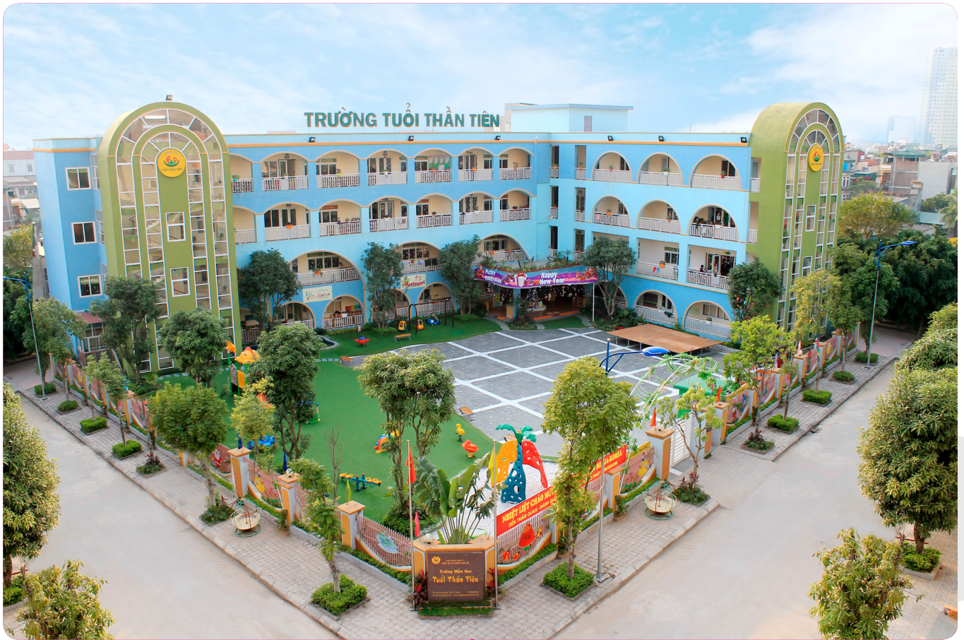
TRƯỜNG MẦM NON TUỔI THẦN TIÊN - ĐẠI THANH