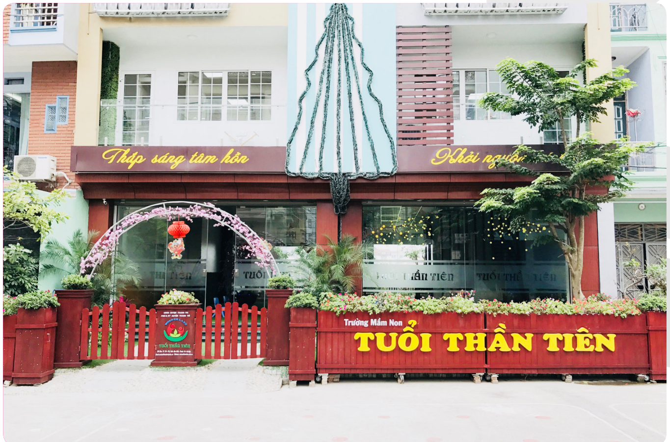
TRƯỜNG MẦM NON TUỔI THẦN TIÊN - THỊ TRẤN VĂN ĐIỂN